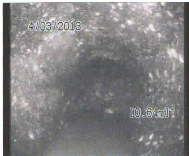
Fotografie: 1_1_3_B.jpg 0,64m, Obecná poznámka %AtJoint%