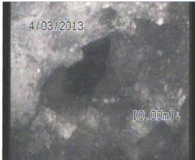
Fotografie: 1_1_2_A.jpg 0,01m, Obecná poznámka %AtJoint%