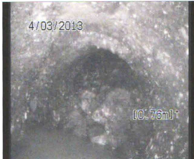
Fotografie: 1_1_3_A.jpg 0,64m, Obecná poznámka %AtJoint%