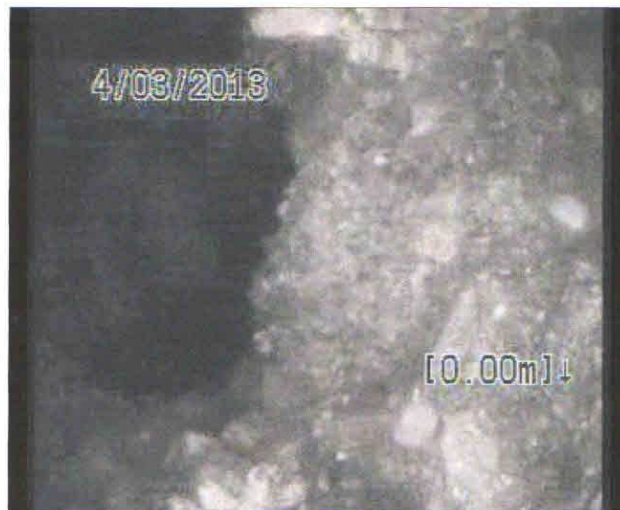
Fotografie: 1_1_2_B.jpg 0,01m, Obecná poznámka %AtJoint%